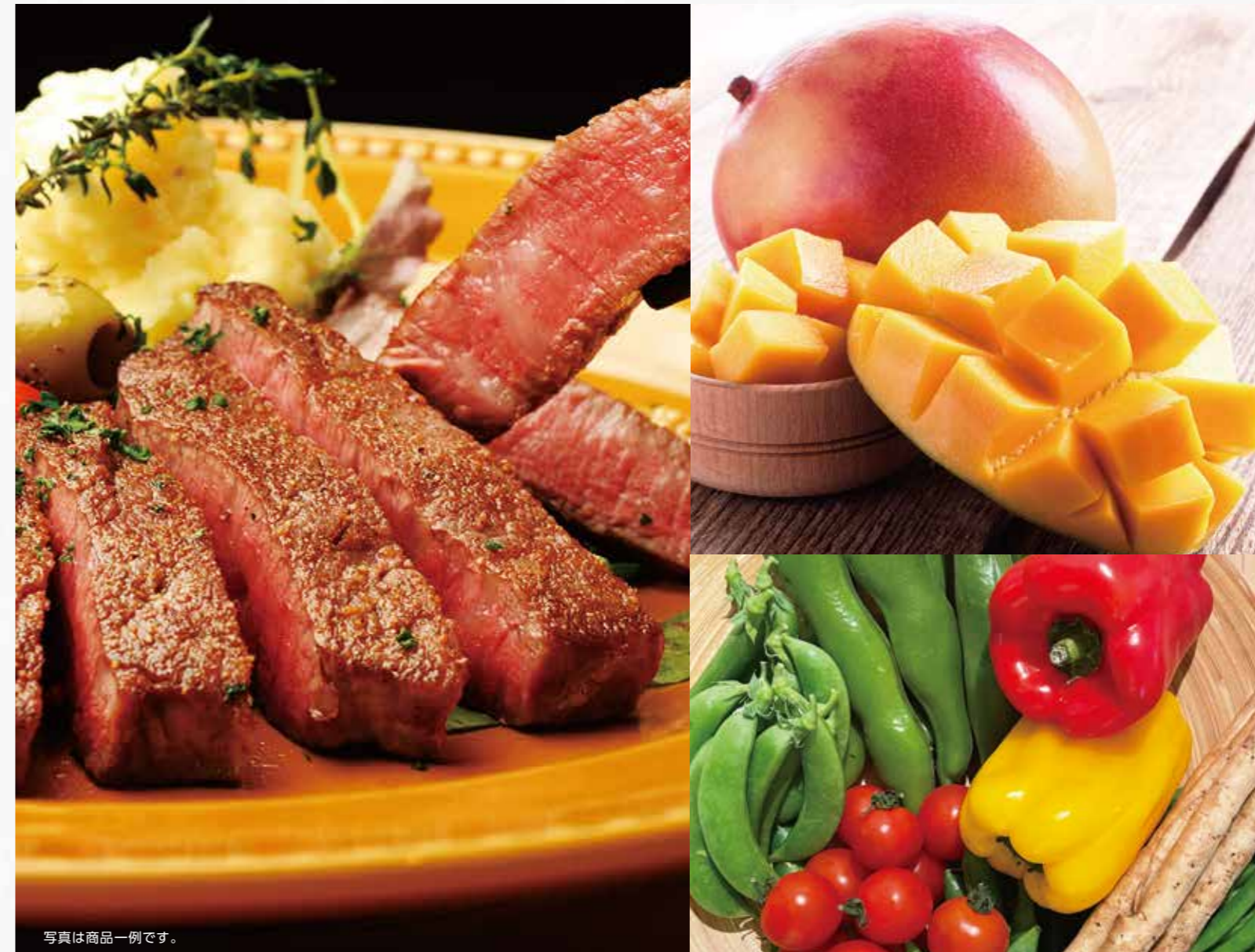
写真は商品一例です。